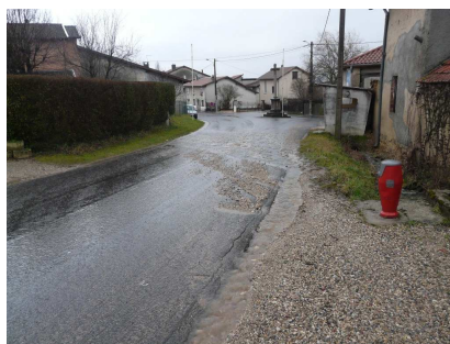
Débordement au niveau de la voirie, les réseaux et fossés n'étant pas en charge