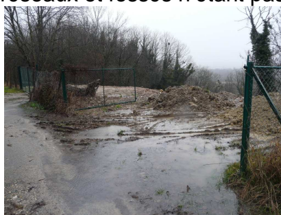
Ruissellement au niveau de la côtière,